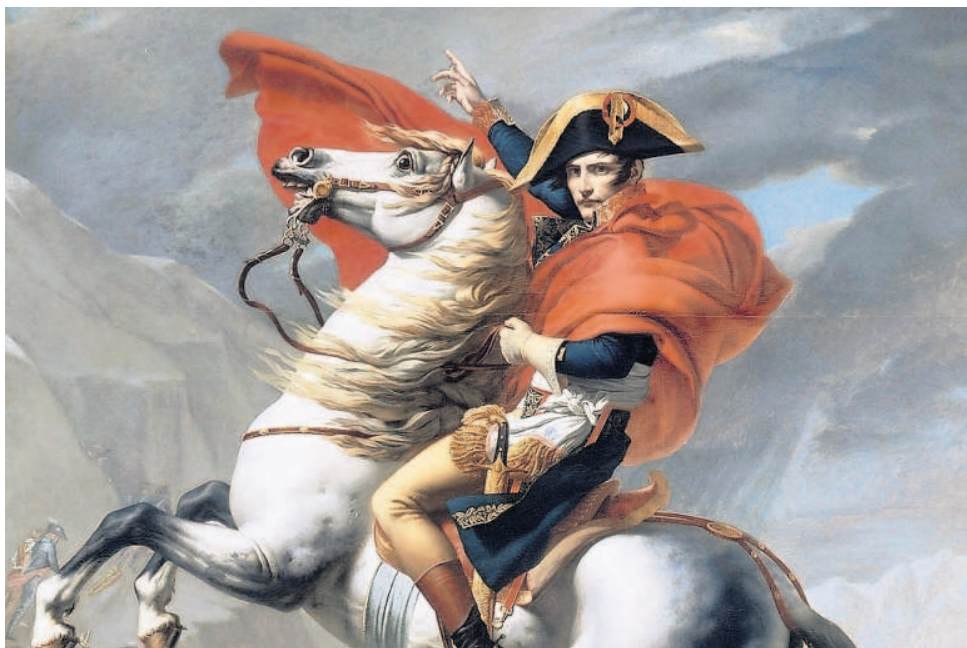
Napoleon, portret van Jacques-Louis David. Na zijn verbanning 'was er niemand meer die de macht heeft de demonen onder ons in te tomen.'